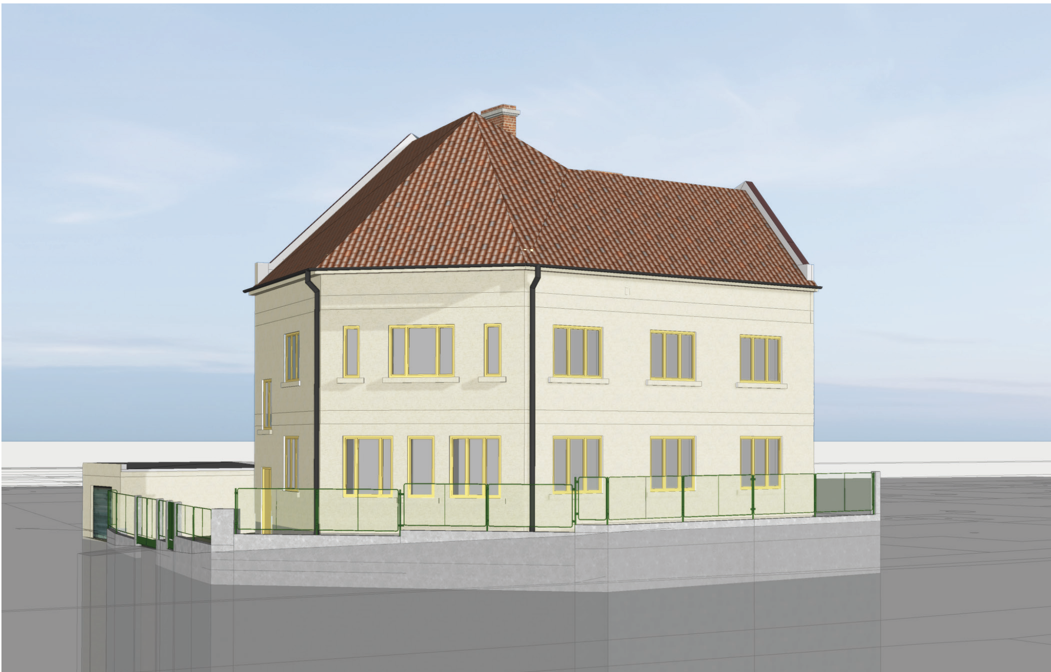
ÚZEMNÍ STUDIE: „Bytový dům u STK Kralupy“, LOBEČ, KRALUPY NAD VLTAVOU | GRAFICKÁ ČÁST pohled na 3d model s úpravami