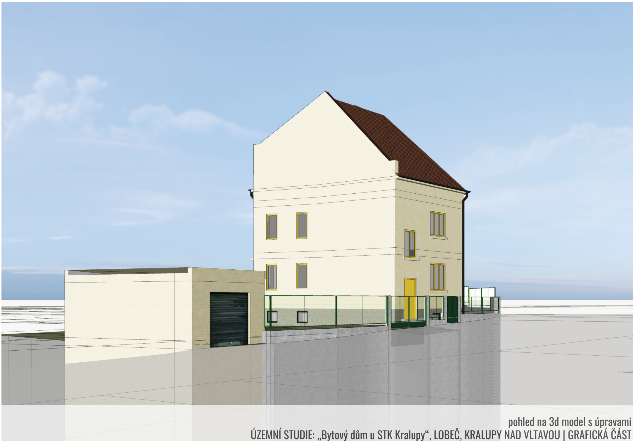
pohled na 3d model s úpravami ÚZEMNÍ STUDIE: „Bytový dům u STK Kralupy“, LOBEČ, KRALUPY NAD VLTAVOU | GRAFICKÁ ČÁST