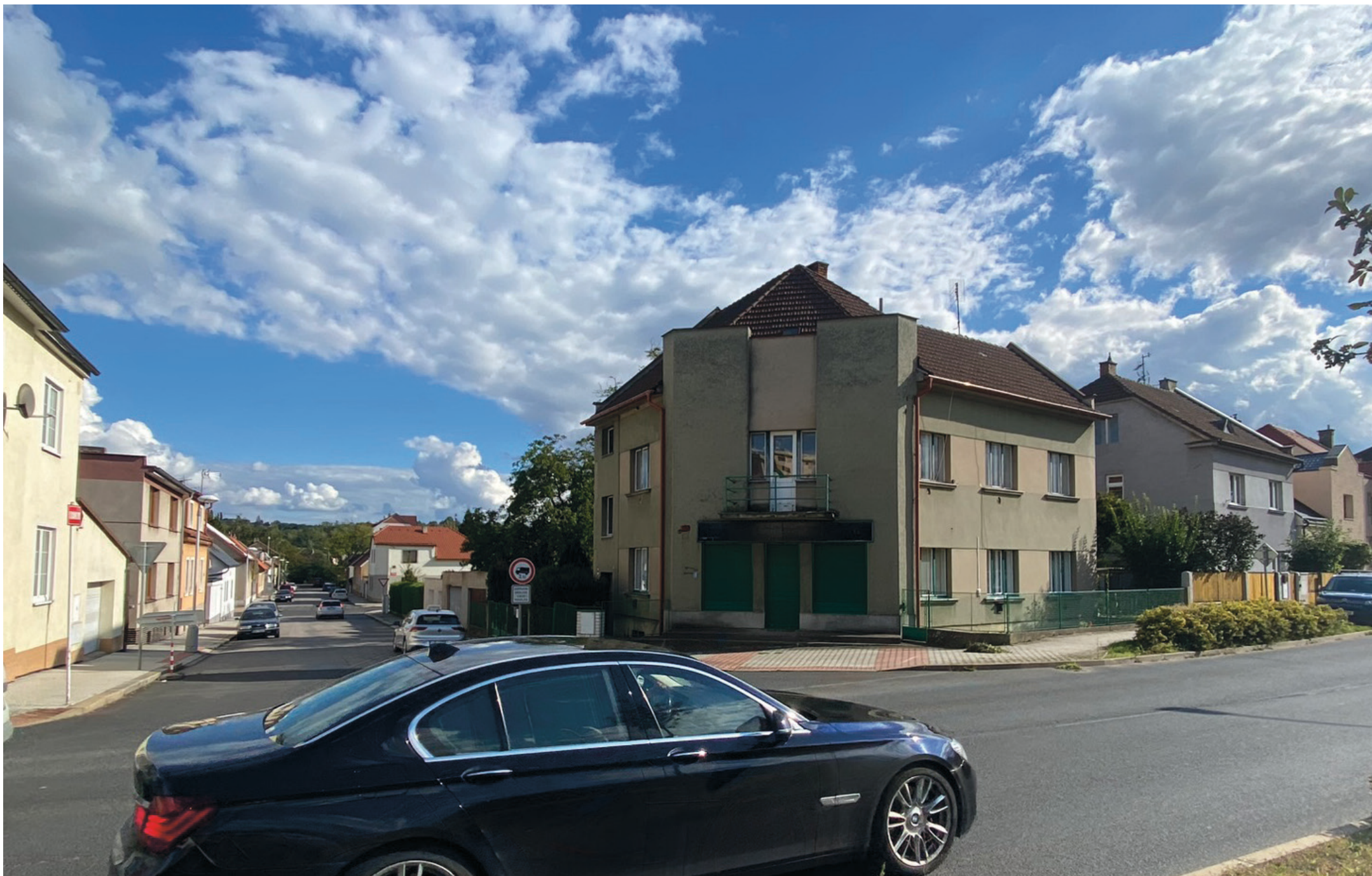
pohled na stávající objekt ÚZEMNÍ STUDIE: „Bytový dům u STK Kralupy“, LOBEČ, KRALUPY NAD VLTAVOU | GRAFICKÁ ČÁST