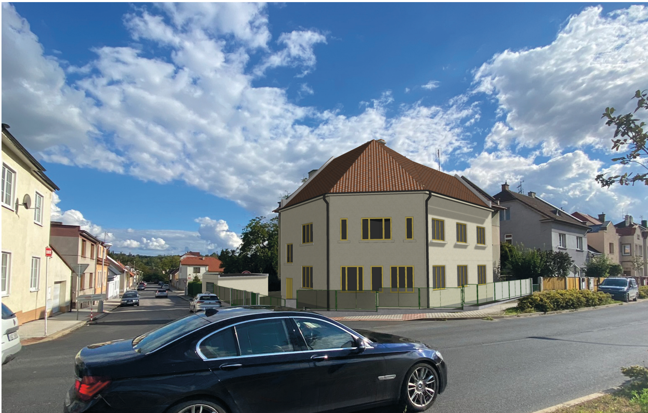
zákres s navrženými úpravami ÚZEMNÍ STUDIE: „Bytový dům u STK Kralupy“, LOBEČ, KRALUPY NAD VLTAVOU | GRAFICKÁ ČÁST